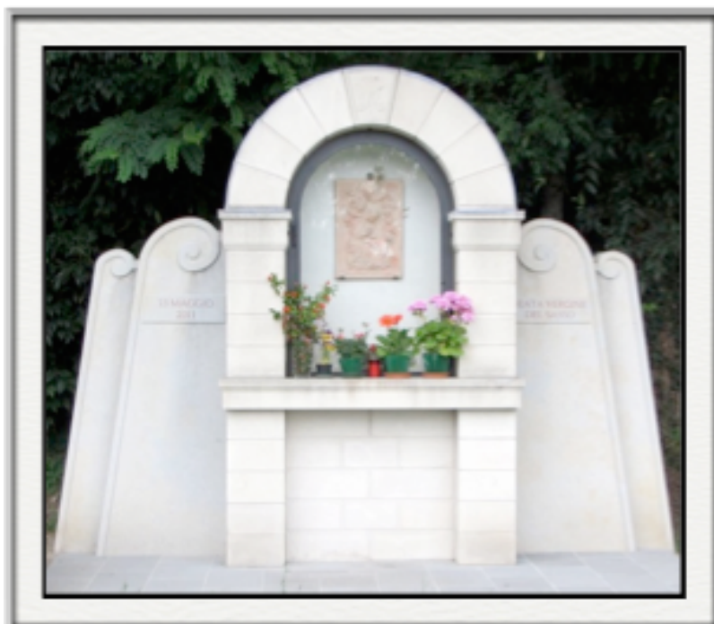
Edicola mariana con la prima immagine della Madonna del Sasso, poi sostituita con l'attuale immagine policroma